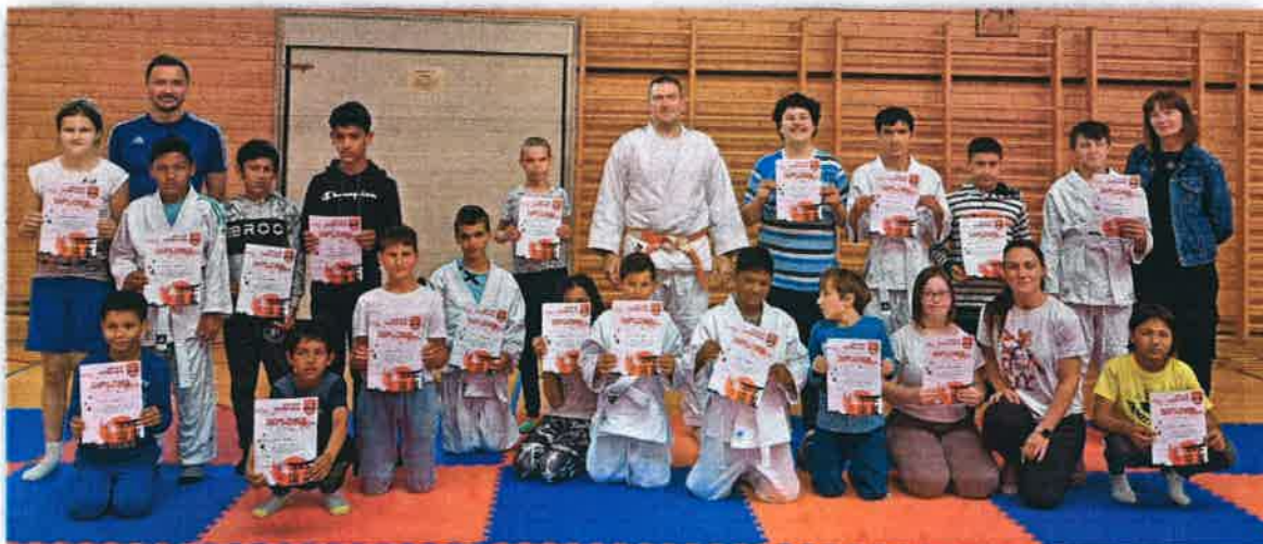
Judo kao nova izvannastavna aktivnost