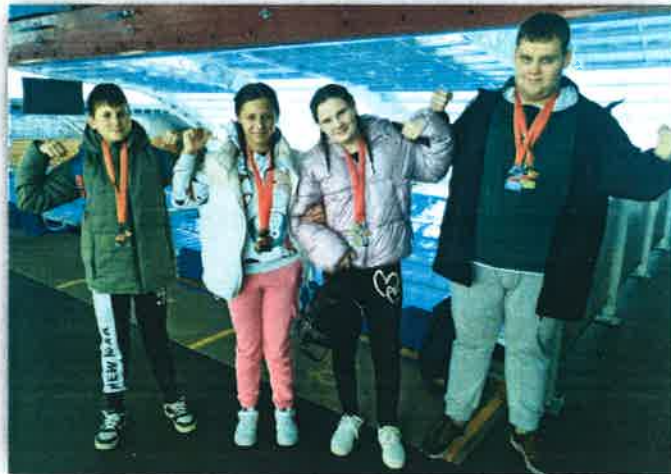
Medalje u svim disciplinama plivanja