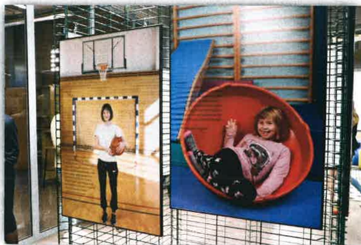
Izložba Djeca OKO nas – Utjecaj, a ne ukras!, ENTER