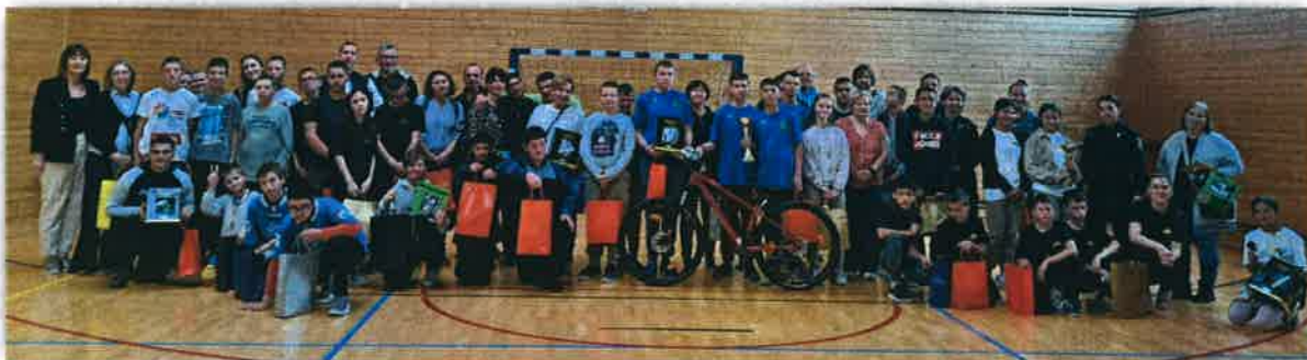
12. Međužupanijsko natjecanje za učenike s intelektualnim teškoćama „Ja u prometu“

12. Međužupanijsko natjecanje za učenike s intelektualnim teškoćama „Ja u prometu“ održano je 25. 4. 2025. u Koprivnici. Natjecanje svake godine organizira Centar za odgoj, obrazovanje i rehabilitaciju Podravsko sunce u suradnji s Policijskom upravom Koprivničko-križevačkom – Pododsjekom za sigurnost cestovnog prometa. Podršku ovom natjecanju prvi put je pružilo i Ministarstvo znanosti, obrazovanja i mladih dodjelom financijskih sredstava u iznosu od 2.560,00 €. Projekt „Ja u prometu“ prijavili smo na Poziv za financiranje preventivnih projekata osnovnih i srednjih škola te učeničkih domova u školskoj godini 2024./2025. Na natjecanju je sudjelovalo 9 ekipa učenika s teškoćama u razvoju: iz Đurđevca, Križevaca, Bjelovara, Virovitice, Velike Gorice, Zagreba, Varaždina, Čakovca i Koprivnice. Ekipno prvo mjesto osvojili su učenici iz Varaždina, pojedinačno učenica iz Đurđevca.