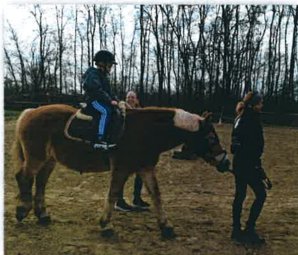
Najmlađi učenici na terapijskom jahanju